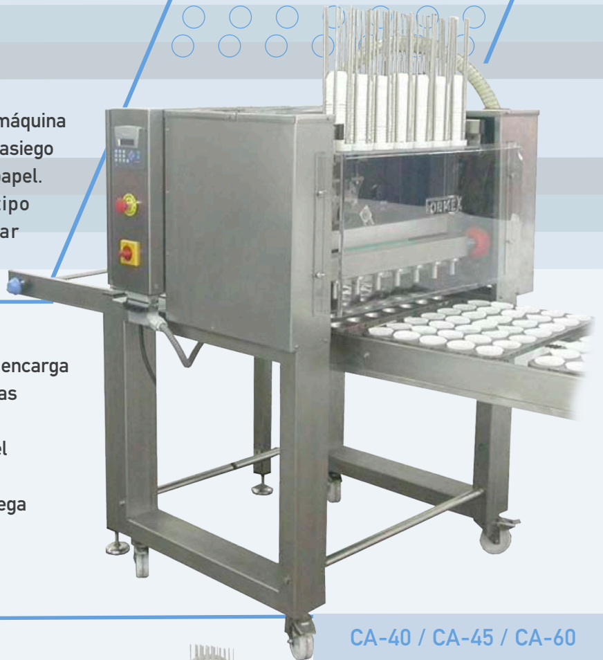
CA-40 / CA-45 / CA-60

La "CA" es una máquina robusta, construida para trabajar 24 horas al día. De fácil mantenimiento. Todos los modelos están dotados de ruedas para facilitar el transporte. La Capsuladora Automática Formex utiliza tecnología muy sencilla a la vez que robusta y eficaz.