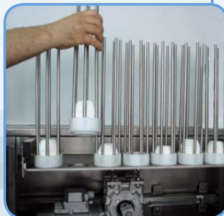
Almacén de cápsulas extraíble e intercambiable.

Bajo pedido realizamos Dosificadoras y Capsuladoras Especiales con diferentes tipos y nº de boquillas, diferentes medidas de bandejas o moldes u otras variaciones técnicas. Consúltenos sin compromiso.