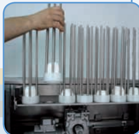
Chargeur du papier extractible.

Sur commande on fabrique doseuses et capsuleuses spécials.