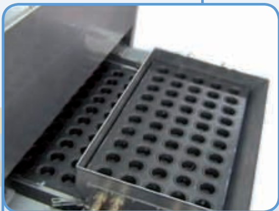
Optionnel: chargeur du plaques.