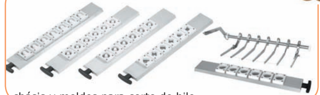
chásis y moldes para corte de hilo

Es una máquina muy completa y de fácil manejo, lo cual permite que sea utilizada por personal no experto, liberando al maestro pastelero para ocuparse en otras labores más profesionales. El cabezal y los accesorios son completamente desmontables permitiendo su limpieza en un fregadero o en una máquina de lavado automático. Construida en chapa y materiales inoxidables y aptos para su uso alimentario.