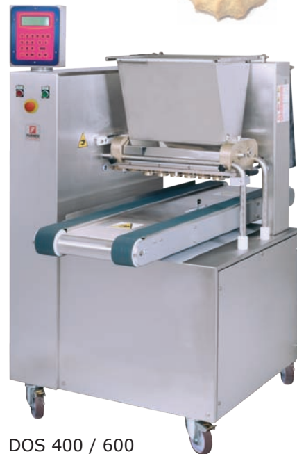
DOS 400 / 600

Formadora y escudilladora de pastas y galletas, capaz de trabajar con masas de diferente textura: masas densas, semidensas y fluidas.