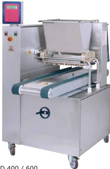
D 400 / 600