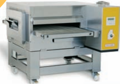
SYN 10/65V SYN 10/75V