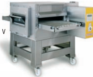
SYN 08/50 V