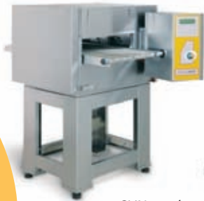
SYN 05/40 V