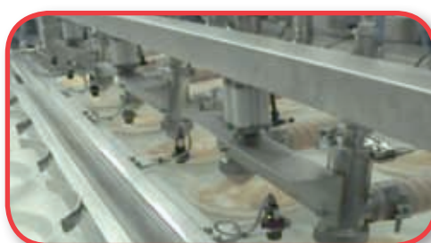
Tortilla de patata

Debido a las diferentes variaciones que pueden tener los modelos, el fabricante se reserva el derecho a modificar las imágenes y características técnicas sin previo aviso.