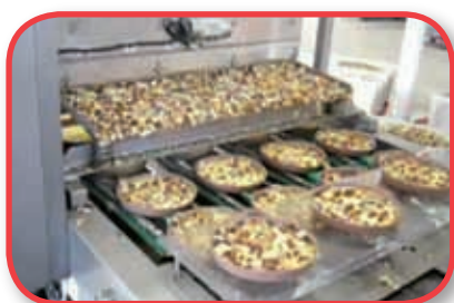
Dosificador de semillas