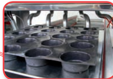
Boquillas especiales para módulo "MA"