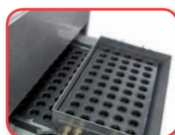
Cargador de bandejas.