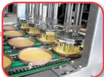
Boquillas especiales para dosificar tartas

Con las Líneas Modulares Formex podrá conseguir la configuración exacta para poder realizar Su Producto.