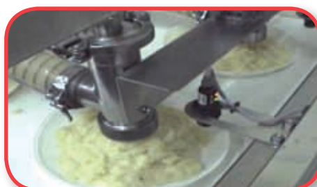
Tortilla de patata