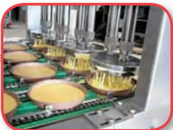
Douilles spéciales pour doser tartes.

Chaque machine de la ligne peut se fabriquer sous les requêtes du client.