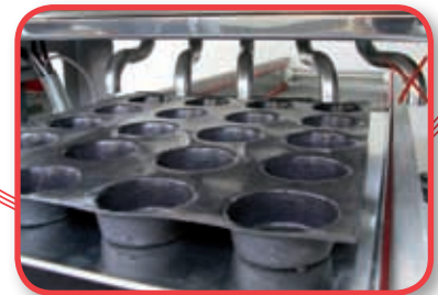
Embouchures doseuses spéciales pour les modèles "MA"