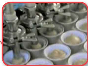
Embouchures doseuses spéciales pour les modèles "MA"