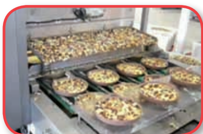
Doser de grain