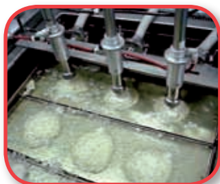
Doser et faire sauter

Plusieurs modules: Elevateur du cuve, tremie a la chaleur, agitateur, etc.