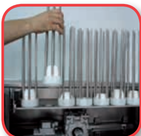
CA, chargeur du papier extractible.