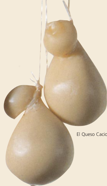
El Queso Caciocavallo

Para la Pizza ripiena debe dividirse la masa en dos partes, para luego servirse de una tortera untada con manteca. Se rellena con la salchicha y el caciocavallo cortado a finas lonchas. Debe reservarse una pizza de manteca para la superficie y cocer la pizza en un horno ya caliente.