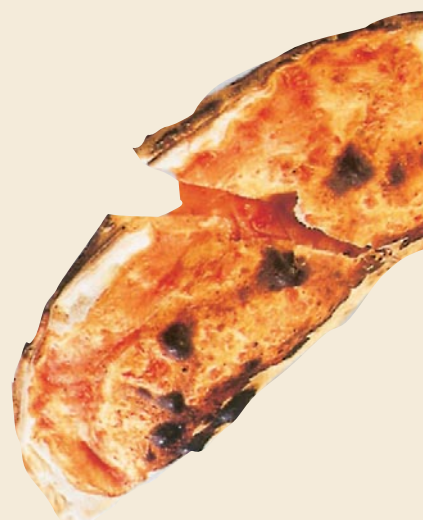
La típica Pizza Ripiena.