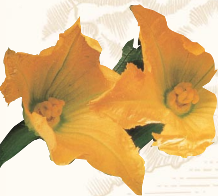
Fiori di Zucca