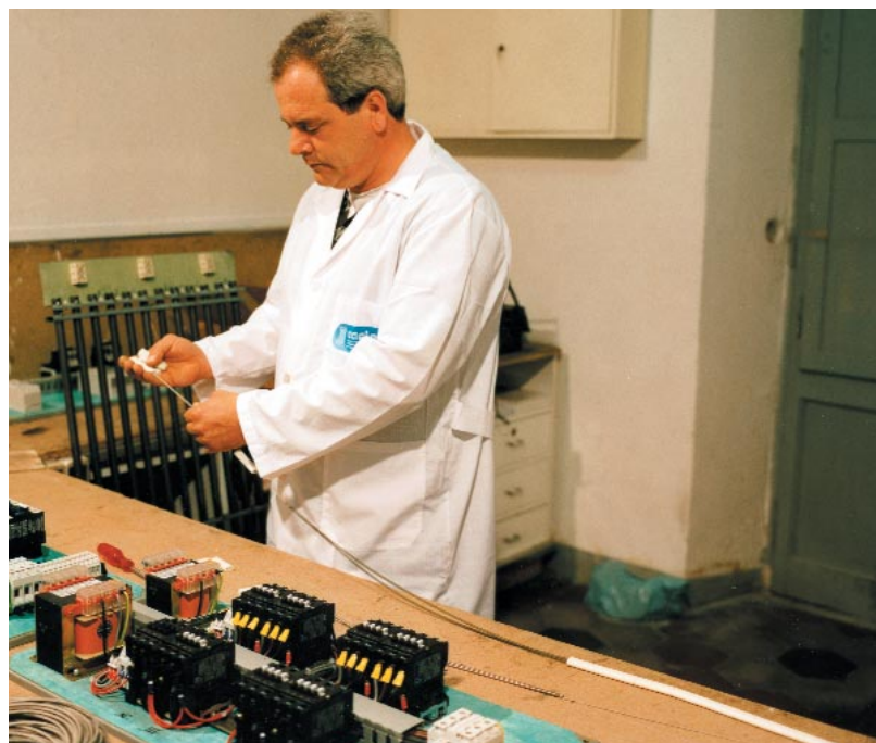
Técnico de Castelli ensamblando una resistencia individual tubular

Son resistencias acorazadas de fabricación casi artesanal que, como dice el nombre, son independientes. Normal-