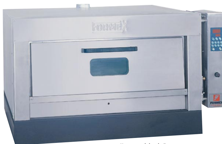
Horno modular de Formex

Otro aspecto importante para una cocción uniforme en un horno eléctrico es la forma de la cámara de cocción. Hay fabricantes que realizan cámara de cocción con forma de bóveda para imitar el horno de leña, pero la mejor forma es la rectangular.