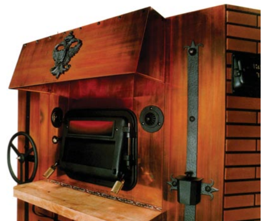
Horno de Tayso

La leña, según el modelo, se sitúa en el interior de la propia cámara de cocción o bien en un compartimento a parte. El primer caso hace referencia a los modelos más tradicionales. En ellos, el pizzero debe prender el fuego en el centro del horno y esperar a que se forme la brasa. Una vez conseguido esto, la brasa se retira al fondo y el horno ya se puede empezar a utilizar. El segundo tipo, por su parte, se refiere a los hornos equipados con tecnología de combustión a fuego indirecto. La combustión de la madera se realiza en una cámara especial de fuegos y de gases, con lo que se evita el contac-