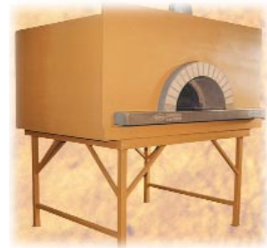
Distintos tipos de hornos de leña de MAM