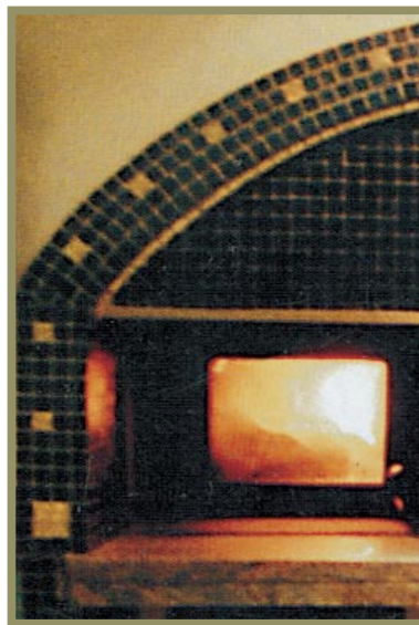
Detalle de Horno de Forni Dintorni

Una opción muy interesante en el ámbito de las soleras rotatorias son los nuevos modelos de horno que incorporan un sistema de elevación de la base