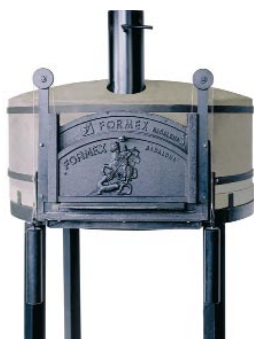
Horno de Formex

Hablar de hornos de leña, en una época de alta tecnología, podría parecer una contradicción. Sin embargo, este tipo de maquinaria es muy apreciada en el mundo de la hostelería, donde está comprobada su efectividad en la preparación de productos que requieran una cocción natural, de gran calidad y que deseen diferenciarse del resto por su carácter esmerado y netamente tradicional. Evidentemente, la pizza ocupa un lugar preponderante entre estos productos y no es de extrañar que fabricantes de todo el mundo hayan dedicado sus esfuerzos a innovar en la materia, eso sí, sin perder nunca de vista los conceptos de tradición y calidad, intrínsecamente asociados a los hornos de leña de toda la vida. El horno de leña es el más antiguo y el precursor del resto de máquinas de este género. El uso de maderas nobles asegura un sabor genuino a los alimentos y otorga a los platos un apreciado toque artesanal. A diferencia de los hornos convencionales de gas o electricidad, el de leña conserva mayoritariamente su forma original abovedada. Esta característica constructiva comparte protagonismo con la geometría interna del horno y la relación proporcional entre la boca y el volumen total de la cámara de cocción. Sin el respeto a estas directrices, el buen funcionamiento de la máquina sería del todo imposible.