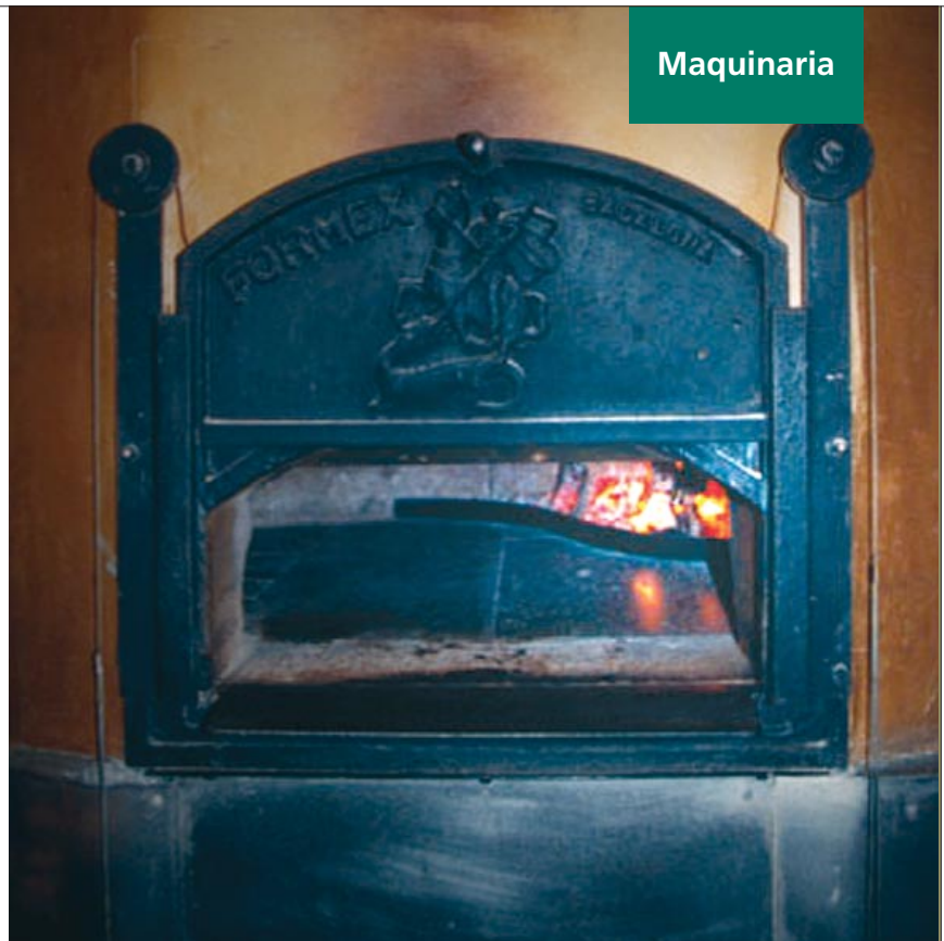
Horno de Formex