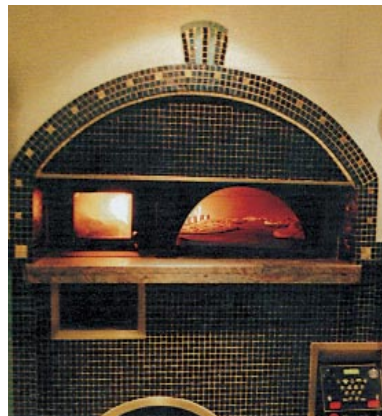
Horno de Forni Dintorni

to directo de la pizza con las cenizas derivadas de la combustión. La cocción en estos hornos se considera más limpia, algo más económica que en el primer caso y sobre todo más adecuada para profesionales con poca experiencia. La cocción con brasas en la misma zona de depósito de la pizza requiere de una gran pericia. Y es que un pequeño descuido, de no más de 30 segundos, puede pro-