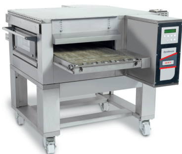
SYN 08/50 V