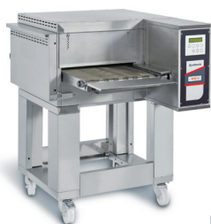
SYN 06/40 V