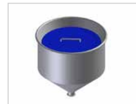
Depósito cilíndrico con tapa de silicona: para masas aireadas.