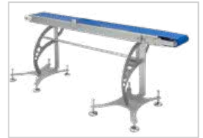
Transportador de moldes sincronizado a la dosificación, una vez posicionados la dosis se realiza automáticamente.