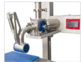
Pistola de corte rotativo: pistola especial para masas elásticas y/o pegajosas en las que el paso de masa viene dado por una válvula giratoria. Para productos semi líquidos suaves, pesados y aireados.