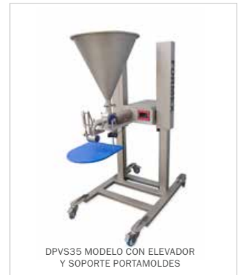
DPVS35 MODELO CON ELEVADOR Y SOPORTE PORTAMOLDES