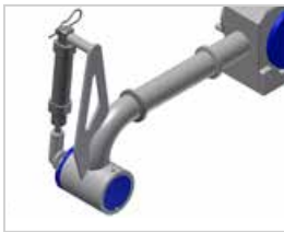
Prolongador de salida: extensión del conducto de dosificación para alejar la salida de dosis.

Se escoge la salida según el producto a dosificar. Su facilidad de montaje y desmontaje ayuda también a las labores de limpieza.