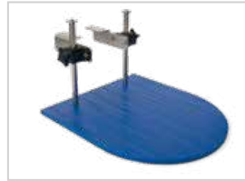
Soporte portamoldes Bandeja acoplada a la salida de la máquina para apoyar el molde o bandeja mientras se realiza la dosis. Se acopla directamente a la máquina de sobremesa.