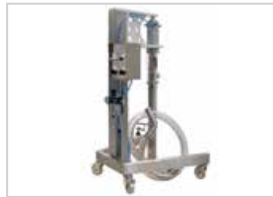
Bomba de traspaso Facilita el traspaso del producto de una cuba de mezcla hacia la tolva lo que permite mantener una producción constante.