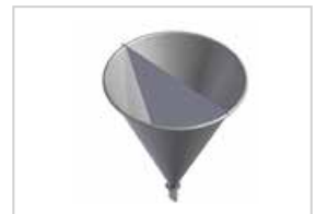
División cónica de depósito: accesorio especial para el depósito para casos en los que haya que dosificar 2 masas simultáneamente.