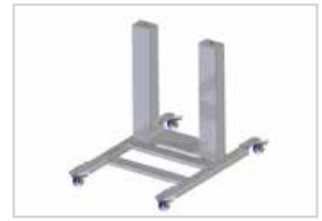
Soporte con elevador Mediante un dispositivo neumático, baja la máquina de sobremesa para poder cargar el depósito. Una vez se ha llenado, se acciona el dispositivo para que la dosificadora regrese a la altura de trabajo.