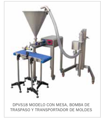
DPVS18 MODELO CON MESA, BOMBA DE TRASPASO Y TRANSPORTADOR DE MOLDES