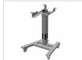
Soporte con ruedas, altura regulable La máquina queda a una altura regulable manualmente de 70 a 100cm.