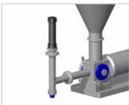
Válvula vertical: Para productos líquidos, semi líquidos y aireados.