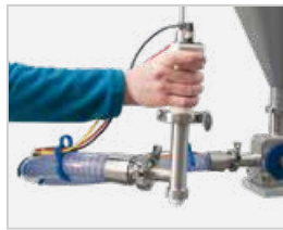
Manguera y pistola de mano: manguera con salida de dosificación móvil, para controlar manualmente el punto dónde dosificar. Para productos líquidos y semi-líquidos.