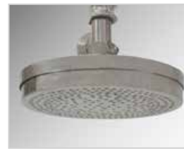
Cabezal de dosificación para salsa de tomate o cremas: salida de dosificación circular en forma de ducha con pequeños orificios, adecuada para esparcir salsas o cremas.