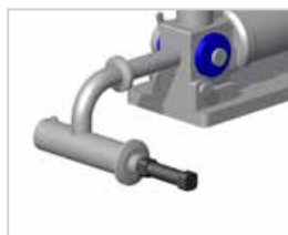
Válvula horizontal: para productos suaves, pesados y aireados.