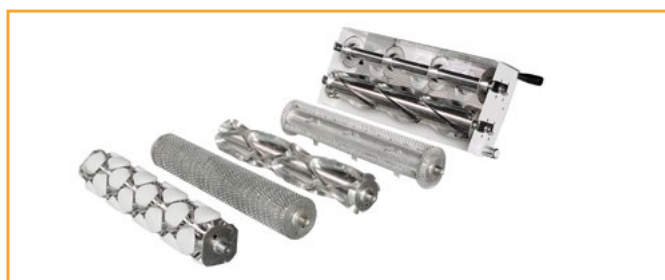
Opcional: rodillos de corte para mdelo SF600