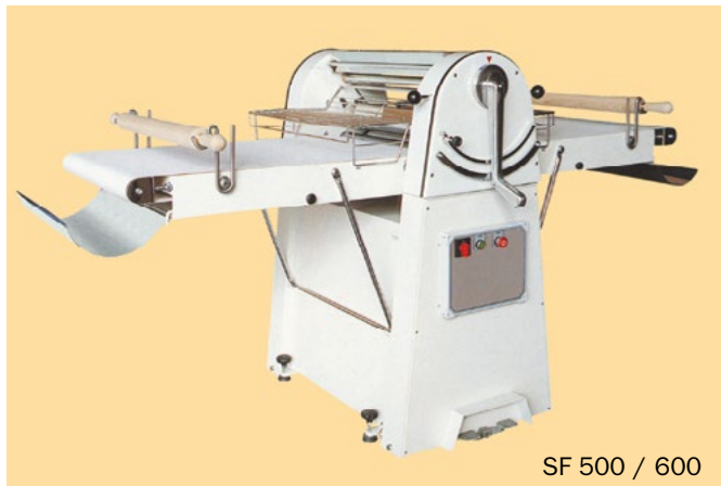
SF 500 / 600

FIABLES, SÓLIDAS, EFICIENTES. DISEÑADAS Y PROYECTADAS PARA GARANTIZAR UN USO EXTREMADAMENTE FÁCIL Y FUNCIONAL.